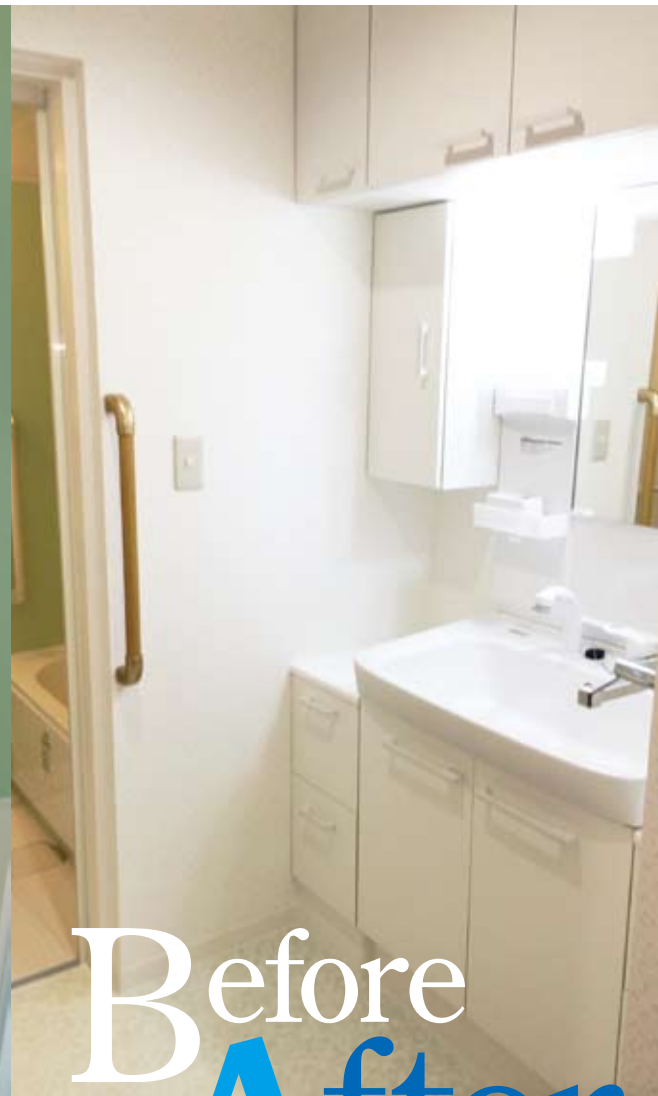
浴室の一面をアクセントパネルにミントグリーンがさわやかな印象 LIXIL BPシリーズ1216を使用